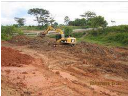
Contrato MA-0011139 Año 2012 Construcción de Locaciones