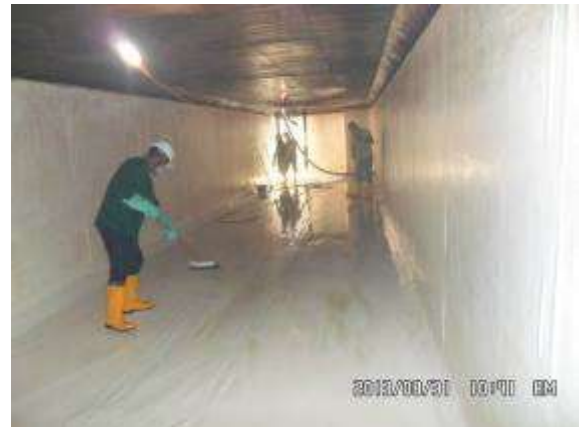
Contrato MA-0029110 Año 2013 Tanques de Policlinica