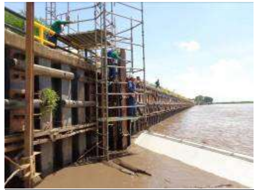
Contrato 5224667 Año 2015 Sistemas de Captación U800/830/850