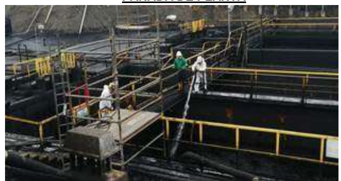
Contrato 3025542 Año 2019 SEP3030