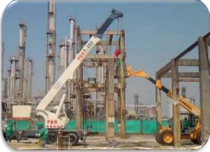
Contrato 4023439 Año 2009 Demolición Planta Alcanos