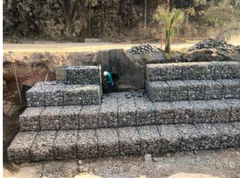
Gaviones Via nacional Contrato 3028575