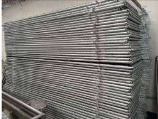
Orden de Compra 5214202 Año 2014 Suministro de Cerramientos para Campo Tibú ECOPETROL S.A.