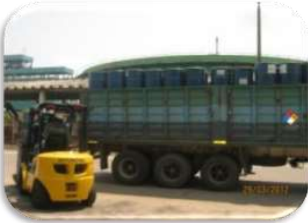
Contrato MA 0003700 Año 2012 Recolección y Disposición final de Residuos Sólidos GRB