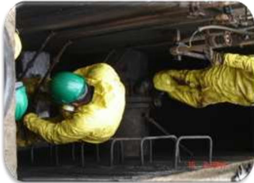
Contrato 4006569 Año 2005 Servicio de limpieza de planta