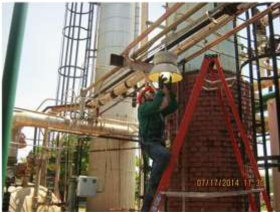
Contrato 5213716 Año 2014 Mantenimiento Eléctrico