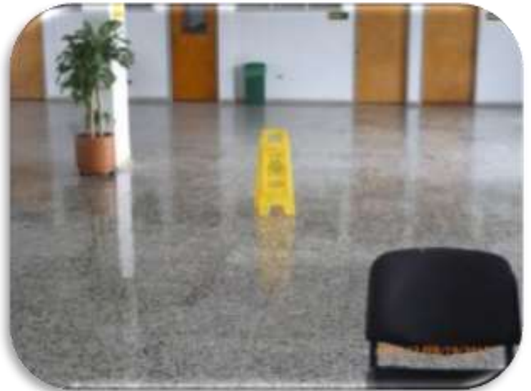
Contrato MA 0000634 Año 2012 Aseo, Cafetería, Rocería Policlínica de ECOPETROL S.A.