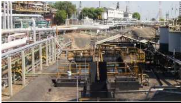
Contrato 3013285 Año 2018 Parada de Planta SEP3020