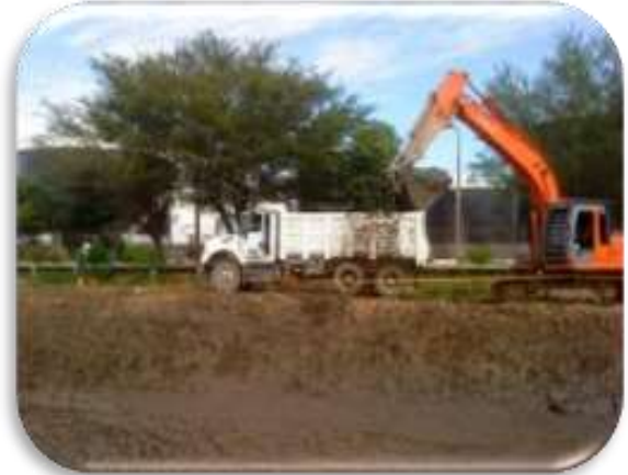
Contrato MA 0001429 Año 2011 Retiro, centrifugación y disposición final de lodos