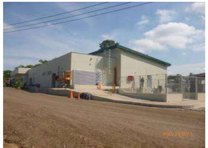
Contrato MA-0015973 Año 2013 Construcción de Centro de Información Técnica ECOPETROL S.A.