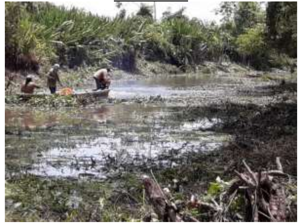
Contrato 2018-111 Año 2018 Restauración y Recuperación Humedales