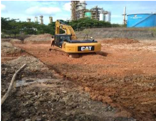
Contrato 3019441 ODS 001 Año 2020 PTAR