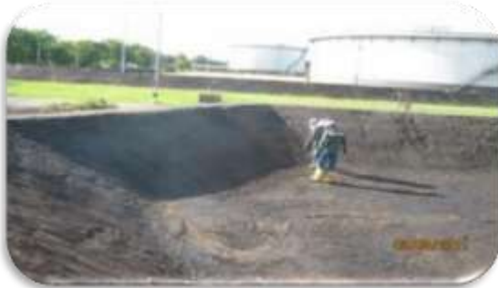
Contrato 4032230 Año 2012 Reparación de Diques Materias Primas