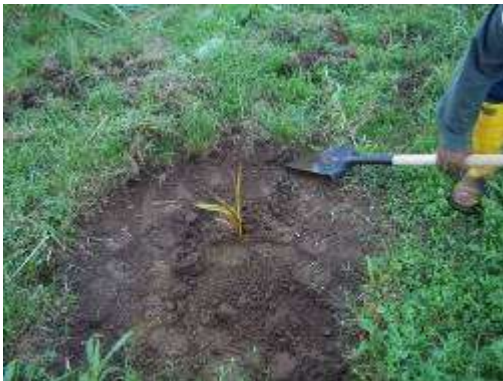
Contrato 5209067 Año 2011 Zonas Verdes Gerencia Regional Magdalena Medio de ECOPEPETROL S.A.