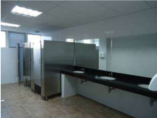
Contrato 3003185 Año 2018 Mantenimiento menor de instalaciones policlínica