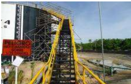
Contrato MA-0015986 Año 2013 Construcción de Escaleras de Acceso a tanques en la Gerencia Magdalena Medio de Ecopetrol S.A.