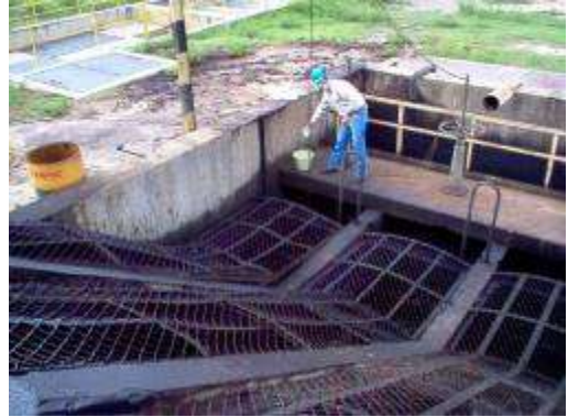
Contrato MA-0030143 Año 2013 Tubería, ECOPETROL S.A