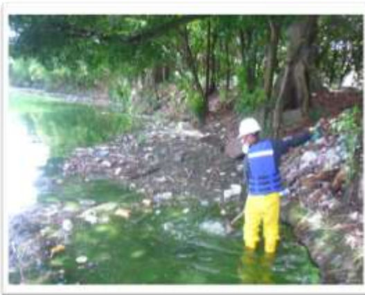
Contrato MA 0008756 Año 2012 Limpieza Ciénaga Miramar ECOPETROL S.A.