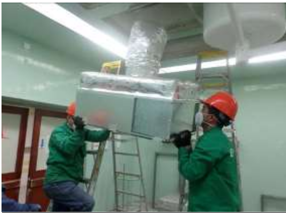
Contrato 3002470 Año 2016 Aires Electromecánico Policlínica