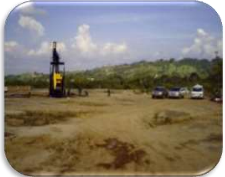
Contrato 5202603 Año 2008 Mantenimiento de Pozos Lizama