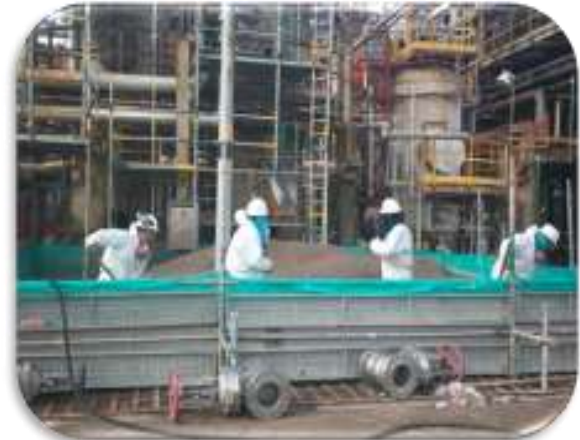
Contrato 4031121 Año 2012 Mantenimiento de Filtros, Zeolitas y Clarificadores