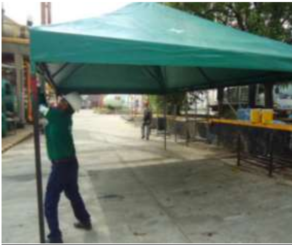
Alquiler y Armado de Carpas Contrato 3010567