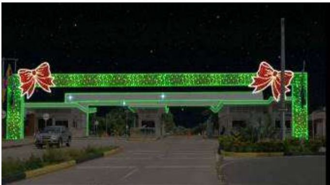
Contrato MA 0032952 Año 2013 Alumbrado Navideño GRB de ECOPETROL S.A.