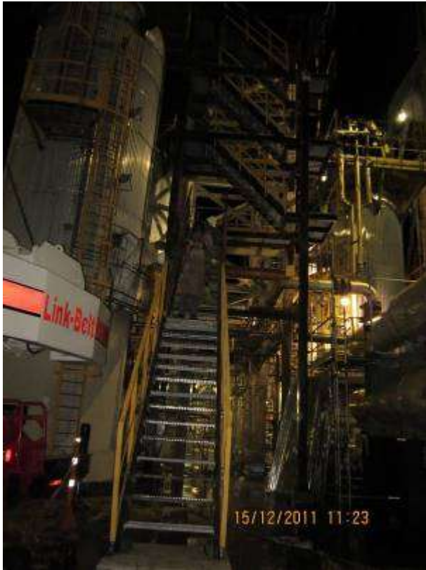
Contrato 4032230 Año 2011 Construcción e instalación de estructuras metálicas Demex ECOPEPETROL S.A.