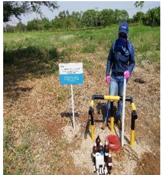
Contrato 3028327 Año 2020 Terminación y completamiento de pozo de monitoreo