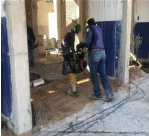
Contrato 3013999 Año 2019 Obras Civiles Colegios PARADA DE PLANTA