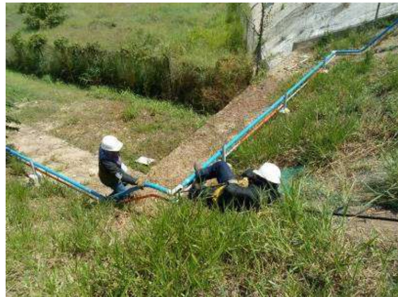
Sub Contrato MA-0015156 INDRA SISTEMAS Año 2013 Instalación de Tubería y Fibra óptica para Seguridad Electrónica de ECOPETROL S.A.