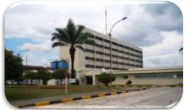
Contrato 4026829 Año 2010 Mantenimiento para la fachada Policlínica ECOPEPETROL S.A.