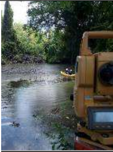
Contrato 3005783 Año 2018 Levantamientos Topográficos Derrames Lizama