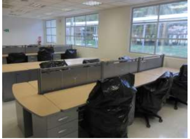
Contrato 5219043 Año 2016 Oficinas Santos y Suerte