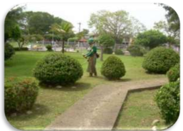
Contrato 5203526 Año 2010 Gerencia Refinería Barrancabermeja