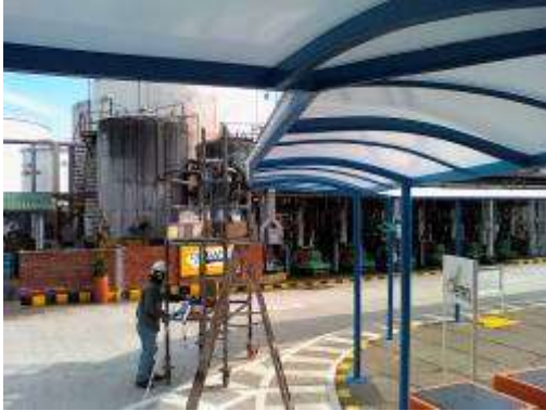
Contrato 4032230 Año 2011 Construcción cubierta de policarbonato en Parafinas ECOPETROL S.A.