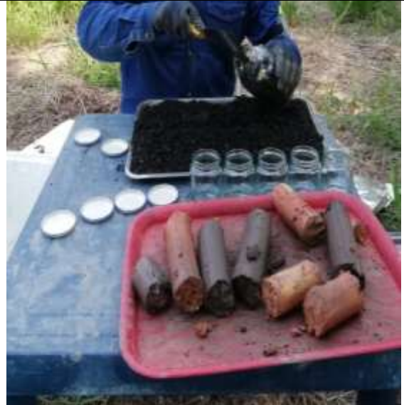
Contrato 3028327 Año 2020 Recolección de muestras para estudio de contaminación