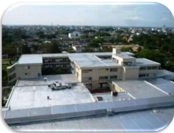
Contrato 4027588 Año 2010 Impermeabilización de cubiertas, tanques, piscinas policlínica ECOPETROL S.A.