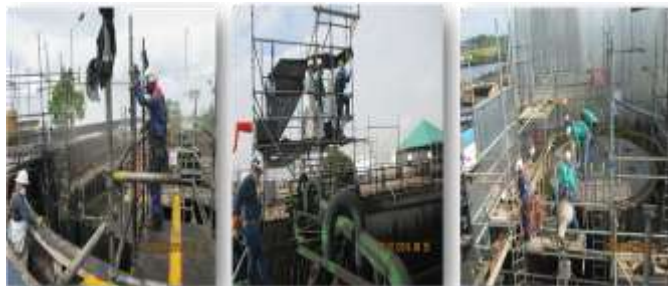
Contrato 5225878 Año 2016 Parada de Planta U4050, SEP3060, TREN CD