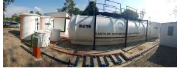
Contrato 3009434 Año 2018 Suministro e Instalación de PTAR policlinica