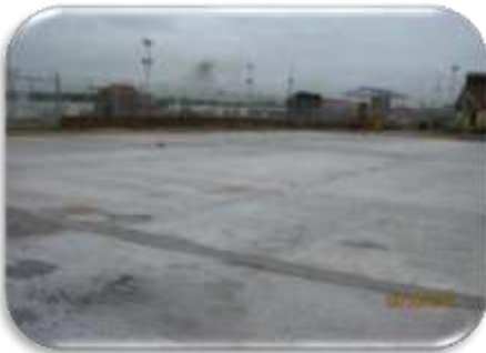
Contrato 4032230 Año 2012 Construcción de piso en concreto Bodega de Materiales ECOPETROL S.A.