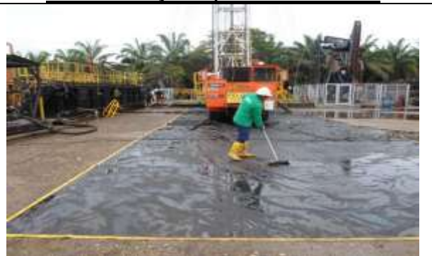
Contrato 3024317 Año 2020 Contención de Fluidos