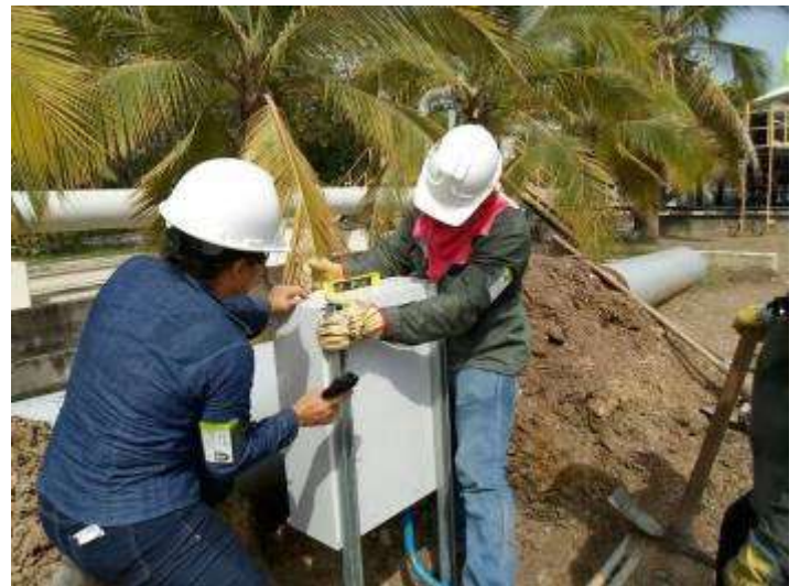
Sub Contrato MA-0015156 INDRA SISTEMAS Año 2013 REFICAR de ECOPETROL S.A.