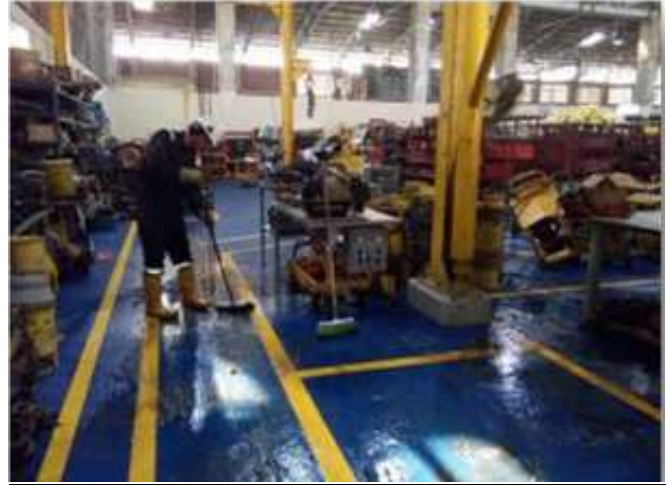
Contrato 3010446 Año 2018 Aseo Refinería Barrancabermeja