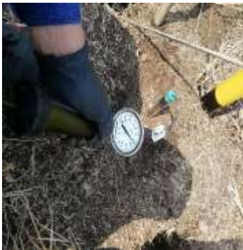
Contrato 3028327 Año 2020 Instalación de lisímetro y toma de muestra de agua