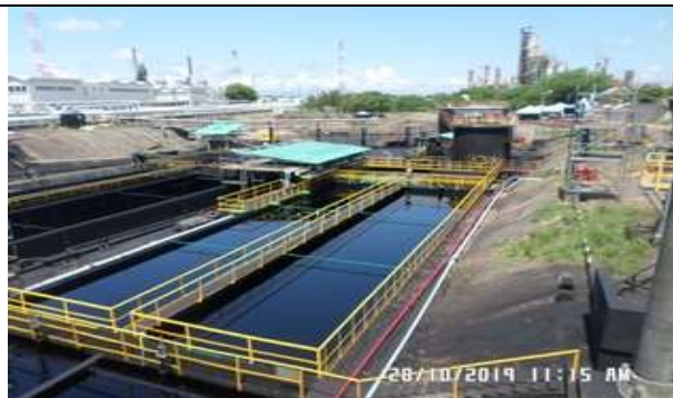
Contrato 3025542 Año 2019 Parada de Planta SEP3030