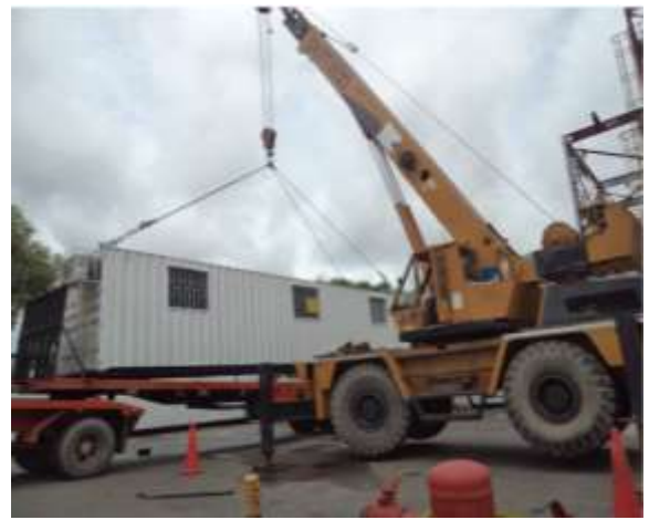
Alquiler de Contenedores Contrato 3010567