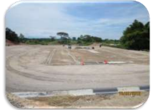
Contrato MA 0011139 Año 2012 Obras civiles y eléctricas locaciones y vías de acceso