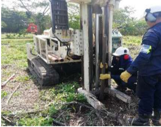
Contrato 3028327 Año 2020 Perforación de pozo para monitoreo