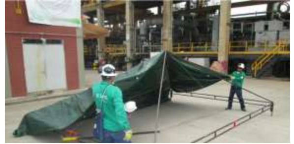
Contrato MA-0017559 Año 2013 Alquiler de Carpas, Baños Contenedores, Logística de Paradas de Planta ECOPETROL S.A.