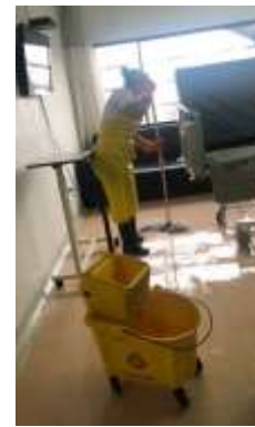
Contrato 3013902 Año 2019 Aseo Policlínica Barrancabermeja