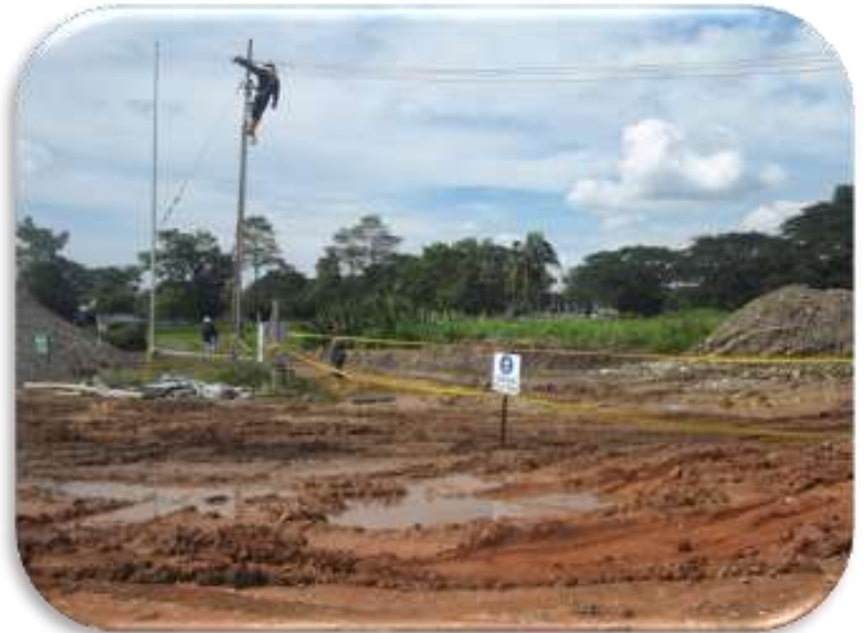
Contrato MA 0011139 Año 2012 Obras eléctricas locaciones