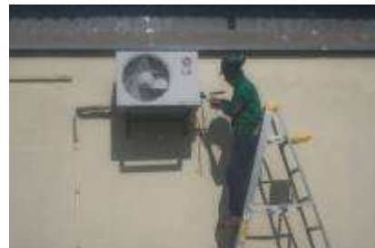
Contrato 5213638 Año 2014 Mantenimiento de Sistemas de Refrigeración en la Gerencia Magdalena Medio de Ecopetrol S.A.