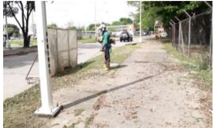
Contrato 3019441 ODS 003 Año 2020 ROCERIA PREDIOS