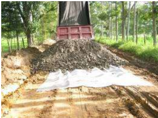
Contrato MA-011139 Año 2012 Vía Pozo Aullador