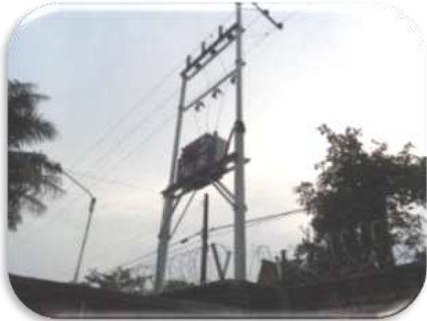
Contrato MA 0002017 Año 2012 Mantenimiento Eléctrico Colegios de ECOPETROL S.A.