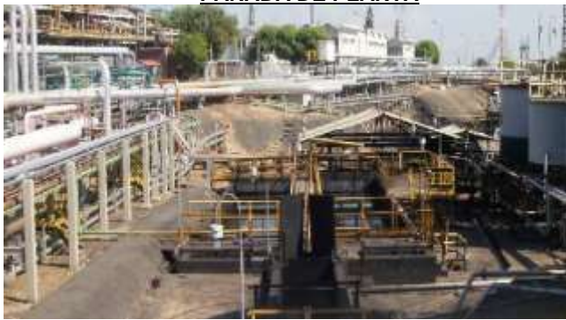
Contrato 3013285 Año 2018 SEP3020