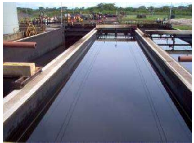
Contrato MA 0030143 Año 2013 Parada PTAR ECOPETROL S.A.