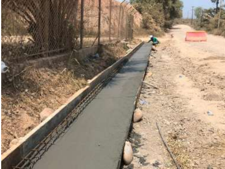
Cunetas Via nacional Contrato 3028575